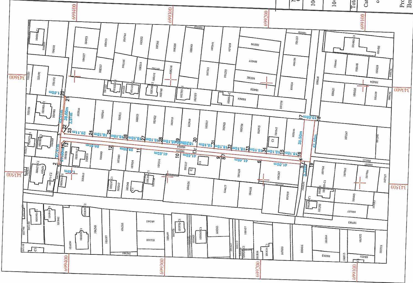
Table de miscare parcelara pentru dezmembrare imobil Situatia actuala (dupa dezmembrare)